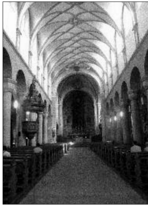
Chrám Panny Marie Sněžné v Kostnici