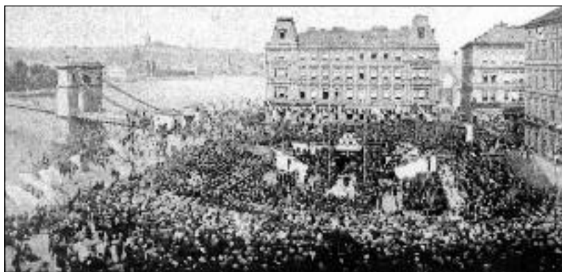
NÁRODNÍ DIVADLO. 150 let od založení Národního divadla v Praze