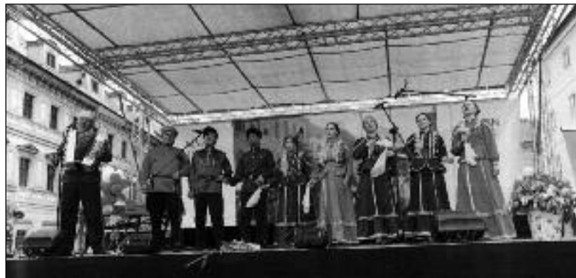
NESMRTELNÝ PLUK - 8. 5. 2018 - Zpívá Folklorní soubor Všeokozáckého svazu českých zemí a Slovenska "Kozáci Vltavy"