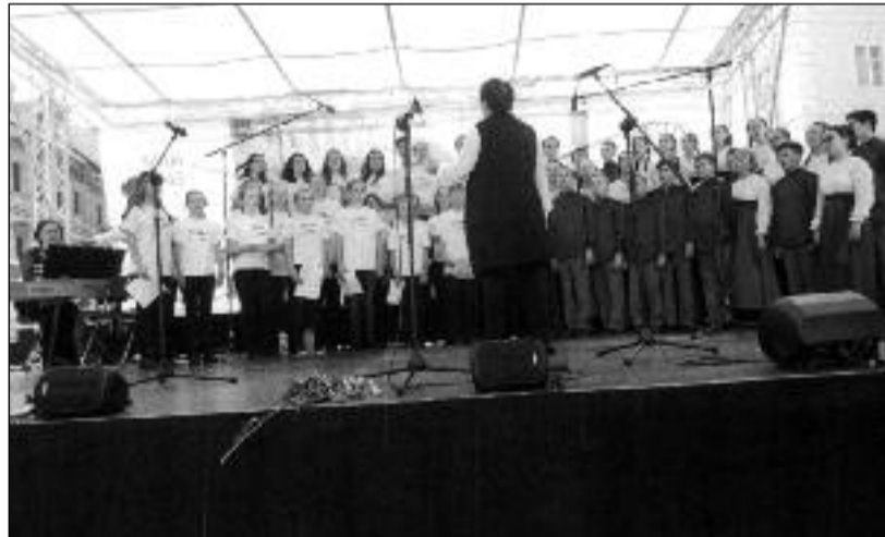
NESMRTELNÝ PLUK - Společné vystoupení Pěveckého sboru "SLUNCE" z Třebíče a Dětského sboru při Centru klasické hudby města Vladimír, Ruská federace