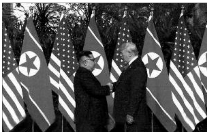
Zleva Kim Čong-un a Donald Trump na jednání v Singapuru