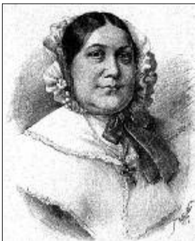
Magdalena Dobromila Rettigová

Jaký mohl být pokrok od generace ke generaci, když matky, v jejichž rukou byly děti, svou nevdělaností je srážely zpět, místo aby je vedly vpřed? To Rettigová v rozličných těch městech a právě v maloměstech poznala velmi dobře, a proto tady se dala do díla.