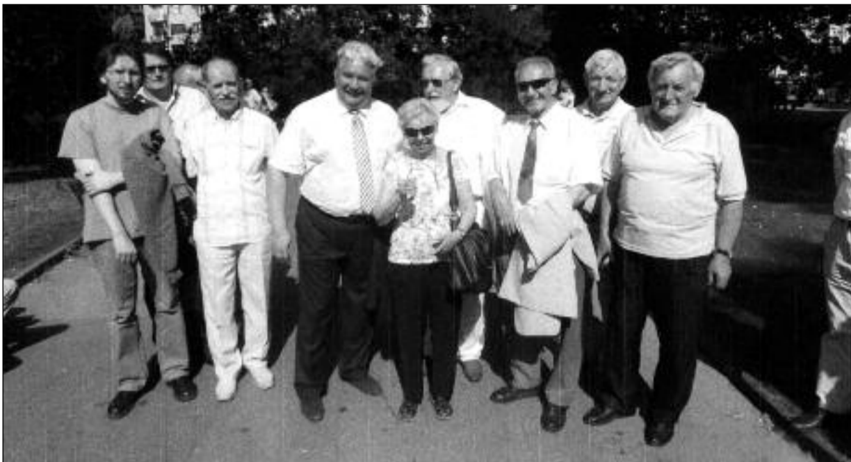
Někteří delegáti na Slovanském ostrově u sochy Boženy Němcové