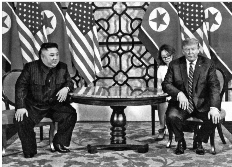
Setkání Kim Čong-una v Hanoji s Donaldem Trumpem