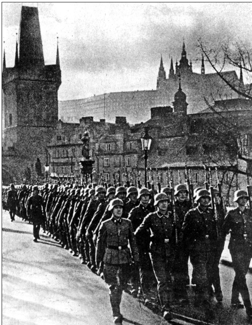
Po pražském Karlově mostě pochodují jednotky německých okupantů naší země

Je třeba, aby všichni pozůstalí po obětech a bojovnicích proti nacismu pozvedli svůj hlas, aby toto přestalo. Je třeba, aby se na univerzitách po létech zamlžování a selhávání historie opět začaly učit přesné a pravdivé dějiny protektorátu a vzdala se čest všem padlým za osvobození republiky. Čest totiž patří všem, bez ohledu na politické postavení, bez ohledu na domácí boj, západní nebo východní frontu! To zločinné vyloučování jedněch nebo druhých musí skončit, jinak nikdy nemůže nastat národní smíření a vyrovnání. Je třeba dát najevo všem lhářům v médiích a v politologické i politické obci, že občané si nepřejí krmění v duchu protektorátních lží a selhávání základních faktů o zrůdnosti nacistické