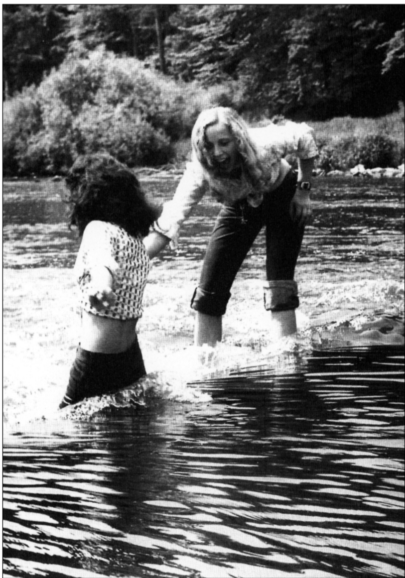
Brodění říčním proudem