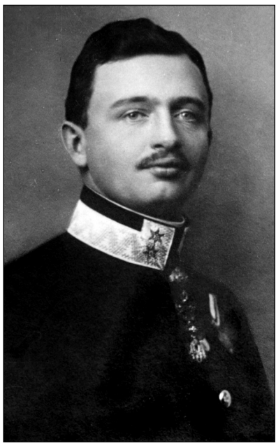
Poslední rakousko-uherský císař a král Karel I.

To, že obnovovaný český stát, respektive 28. října 1918 vyhlášené Československo, nemůže dlouhodobě existovat bez svých pohraničních oblastí, tvořících po všech stránkách s vnitrozemím integrální celek byl kamuflovaný cílem tohoto plánu. Takto zeměpisně a ekonomicky zmrzačené české země by obklopovalo ze všech stran obrovské Německo, které si z nich mohlo kdykoliv učinit svůj koloniální protektorát.