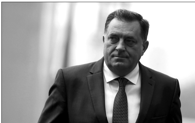
Prezident Republiky srbské Milorad Dodik

Bosenskosrbský předák Milorad Dodik, který je nyní předsedou kolektivní hlavy státu Bosny a Hercegoviny, podle ČTK pohrozil odtržením Republiky Srbské, pokud tato část země na Balkáně bude nucena, aby změnila svůj název! Strana demokratické akce, reprezentující zájmy muslimských Bosňáků, v lednu oznámila, že hodlá u ústavního soudu zpochybnit název Republika Srbská. Ta od daytonské smlouvy z roku 1995 tvoří Bosnu společně s bosňácko-chorvatskou Federací Bosny a Hercegoviny (FB a H) a malým federálním distriktem kolem města Brčko.