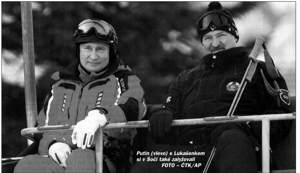
Putin (vlevo) s Lukašenkem si v Soči také zalyžovali

Prezidenti Ruska a Běloruska Vladimir Putin a Alexandr Lukašenko během únorových rozhovorů v Soči projednali osud obou zemí po svém odchodu do politické penze. Otázka svrchovanosti Ruska a Běloruska, o jejichž možném sloučení se spekuluje, prý na pořadu nebyla.