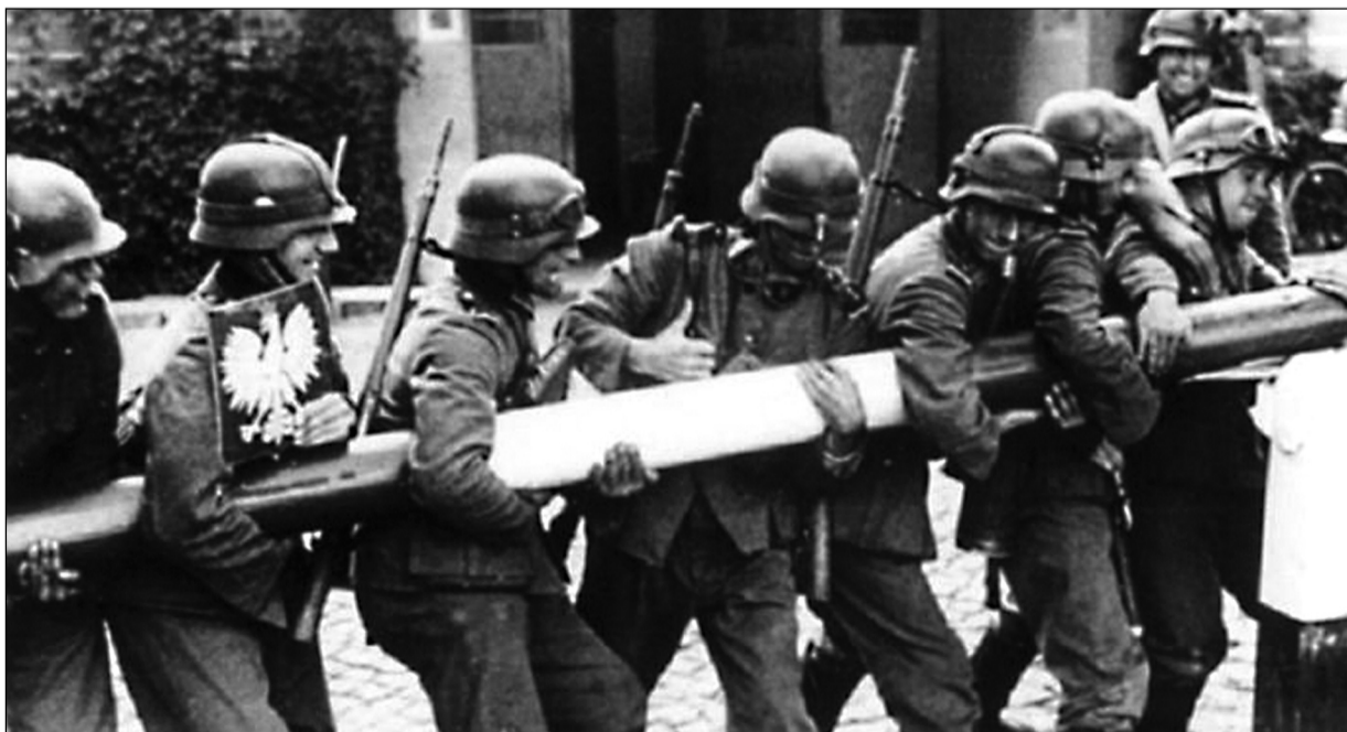
Hitlerovští vojáci vylamují hraniční závoru Polska