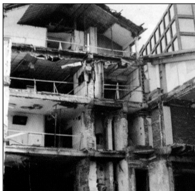
Foto z bombardování Bělehradu roku 1999. Agresori se ze začarovaného kruhu ještě nedostali. Ale srbský národ žije a nedá se zlomit

v nich mohli převézt noví mrtví. Ti, kdož dnes nesli na ramenou mrtvé druhy a pohřbívali je, názití i sami byli nesení v průvodu a pohřbívaní.