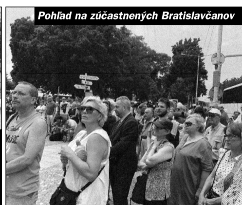
Pohľad na zúčastnených Bratislavčanov