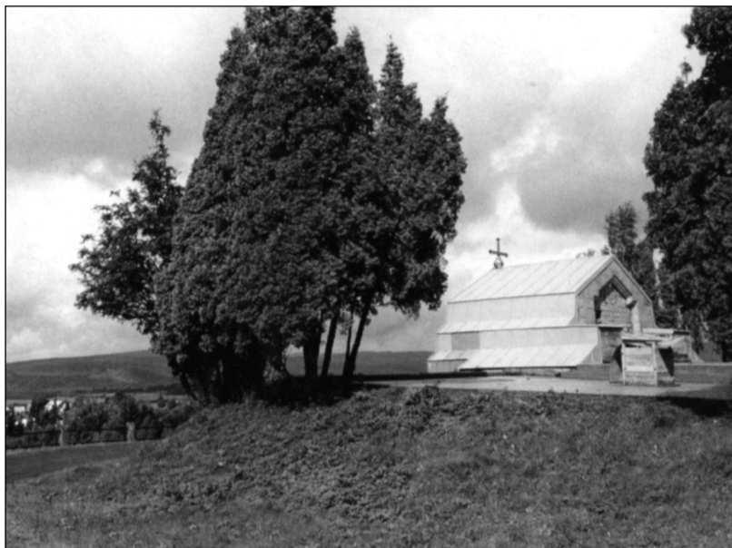
Obnovená kostnice mauzoleum

Podmínky v táborech byly tak hrozné, že tu vězňové mohli jenom umírat a ne přežít. Každého dne ke třetí hodině odpolední opouštěl tábor smutný průvod. Vpředu byl nesen kříž a za ním následovaly rakve se zemřelými. Podle toho, kolik jich bylo, buď na ramenou spolutrpicích, anebo na vozích. Těla byla vyjímána z rakví, kladena do společného hrobu a rakve se vracely zpět, aby se