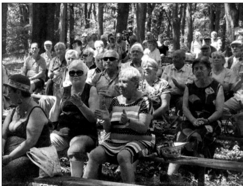
Účastníci vzpomínkového setkání na Pintovce v Táboře

Husovy myšlenky byly nejen neortodoxní a nekonzervativní, ale také pevně spjaté s obyčejným lidem, řekl Filip. Lidé si vždy uvědomovali sami sebe a snažili se zlepšit své postavení ve společnosti. Jedním z hlavních motorů toho pohybu by-