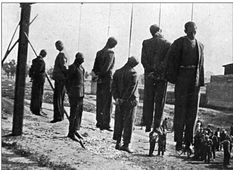
Oběti hitlerovské okupace – pověšení polští civilisté

venska mnichovským diktátem Velké Británie, Francie, Německa a Itálie. To byl vrchol těchto „lábánek“.