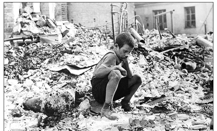
Malý chlapec v troskách vybombardovaného města