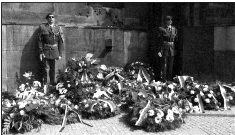
Pieta 18. června před chrámem sv. Cyrila a Metoděje pražské Resslově ulici připomněla hrdinný boj čs. parašutistů s nacistickou přesilou