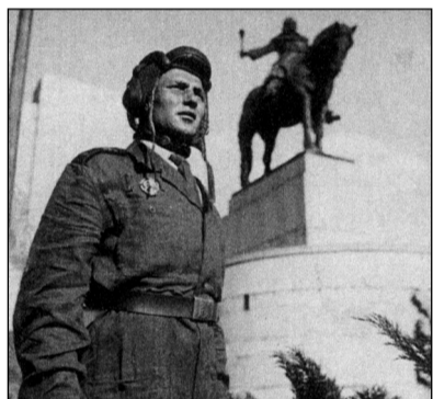
Tankista československé armády před jezdeckou sochou Jana Žižky z Trocnova na pražském Vítkově, 1952

a legionářská pojmenování. Po únorovém převratu v roce 1948 armáda nastoupila cestu k sovětizaci. Důležitou součástí tradic vedle čs. rudoarmějců, interbrigadistů a činnosti čs. jednotek v SSSR zůstal i odkaz husitství.