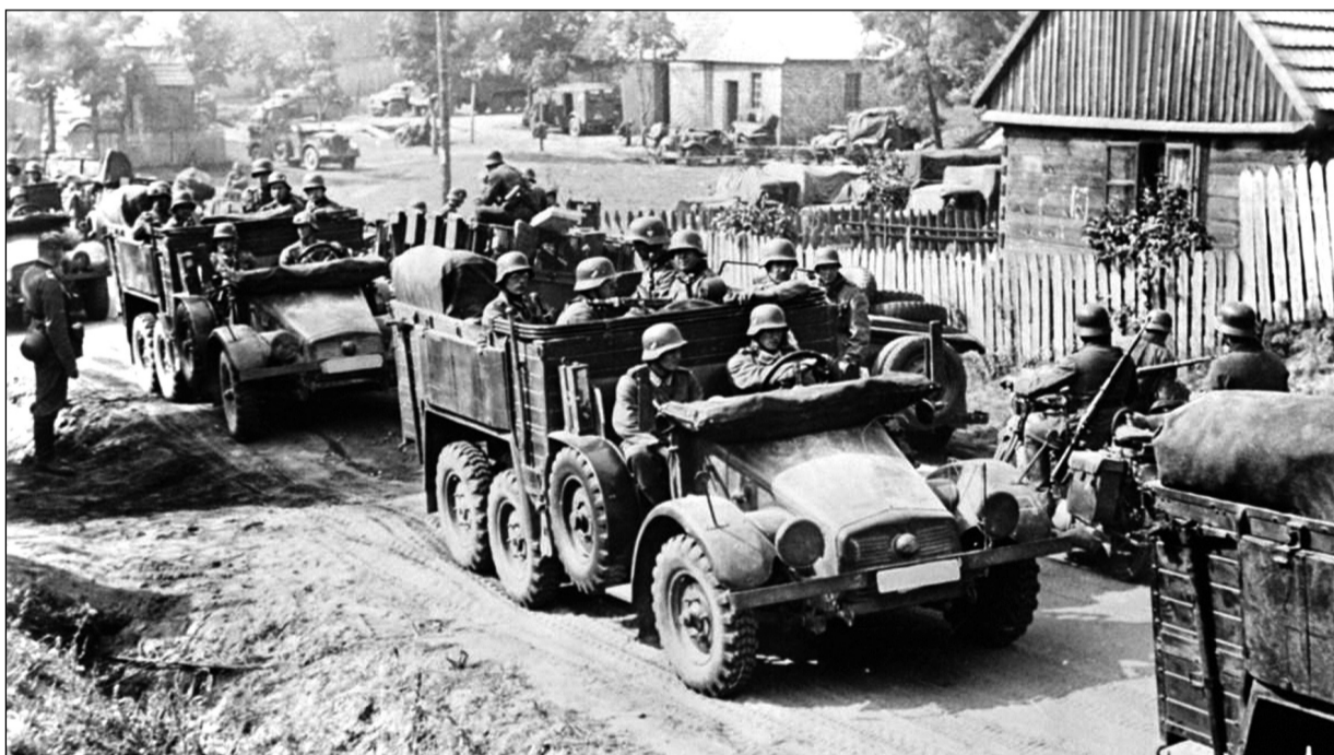
Německý vpád motorizovaných jednotek na polské území

Celostátní shromáždění Slovanského výboru ČR se koná 5. října 2019 od 9,30 hodin v místnosti číslo 153 budovy ÚV KSČM v ulici Politických vězňů 9 Praha 1. Další příznivci myšlenky slovanské jednoty a soudržnosti jsou na tomto aktivu srdečně vítáni. Promluví tady redaktor Haló novin Roman Blaško, který ze své reportážní cesty na Ukrajinu podá svědectví o fašizujících projevech v této slovanské zemi. (SV)