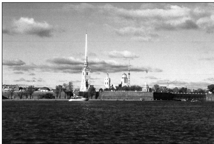
Řeka Něva a Petropavlovská pevnost

Odjíždíme zpět a ještě před polednem se dostáváme zpět do města. To je však na mnoha místech uzavřeno právě kvůli svátečnímu dni. Řidič nás vysadí kdesi na křižovatce a pokynem ukáže kudy kam. Nějak se dostaneme k hlavní Něvské třídě. Je velice teplo a svítí ostré slunce. Víme, že oslava Dne vítězství začala v ranních hodinách vojenskou přehlídkou a posléze pochodem „Nesmrtelného pluku“. A když přicházíme po několika hodinách, Něvská třída je stále v pohybu. Účastníci za-