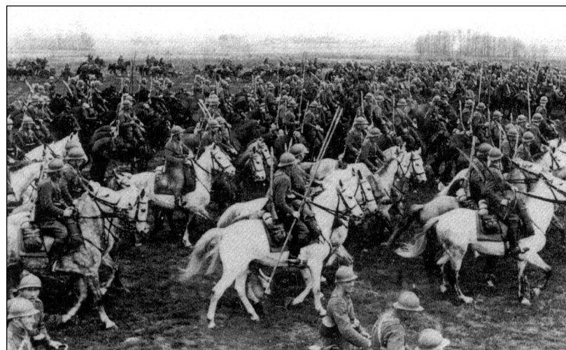
Přetrvávajícím mýtem září 1939 jsou legendy o jezdeckých atacích Poláků proti německým tankům. Na předválečném snímku se polský hulánský pluk šikuje k přehlídce

Na severním úseku Němci zablokovali polské jednotky v pomofanském koridoru, z něhož se musely probíjet. Po střetnutí u Mlawy 3. 9. nezbylo Polákům nic než ustoupit. Už den předtím německá skupina armád Jih prolomila polskou frontu v prostoru Čenstochov. Armády Lodž, Kra-