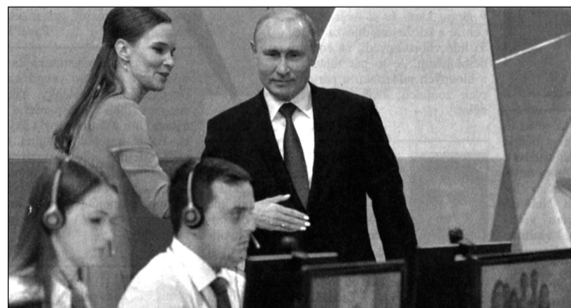
Vladimir Putin během více než čtyřhodinové besedy slíbil posluchačům růst reálných příjmů, investice do zdravotnictví a školství, snížení inflace a rozvoj infrastrukturních programů

Zelenského strana Služebník lidu má nyní velikou historickou šanci změnit zjizvenou tvář země, zbrocenou krví a ekonomickými propady. Dokáže být opravdovou oporou národa nebo dál půjde válečnými zákopy zmaru a smrti a nechá se přitom zavléci do agresivního paktu NATO a stane se jeho poníženým slouhou?! Ruská diplomacie volby označila za „hlasování naděje“. Jejich výsledný obraz jenom potvrzuje, že Ukrajinci jsou „unavení politikou zastrásování a teroru, který rozsazoval předchozí režim.“ (ČTK, jel)