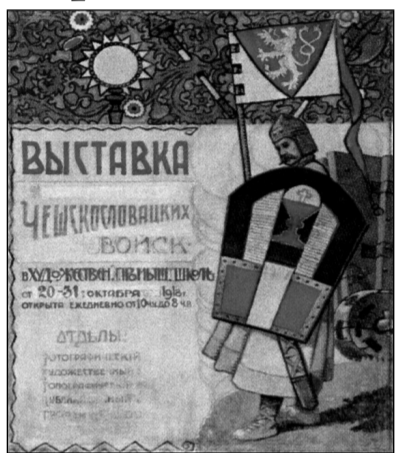
Husitský válečník s bojovým vozem byl ústředním motivem plakátu Františka Záhorského – Ziegelheima pro výstavu čs. legií konanou v Jekatěrinburku v r. 1918

Po roce 1945 byla husitská tradice v československé armádě stále přítomná zejména v názvech útvarů, které navazovaly na předválečnou