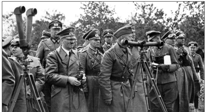
Adolf Hitler a Heinrich Himmler před obleženou Varšavou