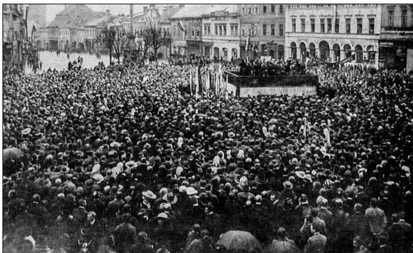
Před 103 roky vznikla Československá republika. Na snímku z 28. října 1918 slaví lidé v Mladé Boleslavi převratný okamžik