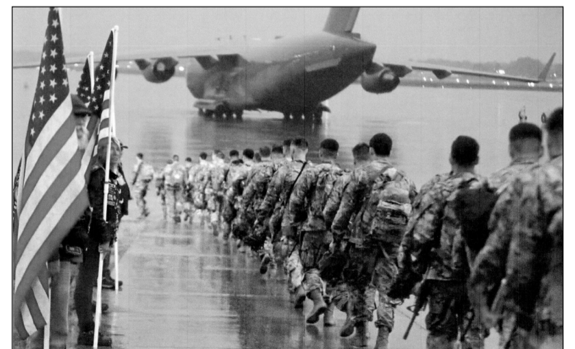
Pokoření američtí okupanti pochodují k odletu z Afghánistánu

lidi, kteří tam žijí. A v podstatě tam zavádět své normy a standardy života včetně politické organizace společnosti,“ řekl Putin při setkání se školáky během cesty na ruský Dálný východ. „Výsledkem jsou samé tragédie. Samé ztráty. I pro ty, kdo to udělali, pro Spojené státy, a tím spíše pro lidi, kteří žijí na afghánském území.“