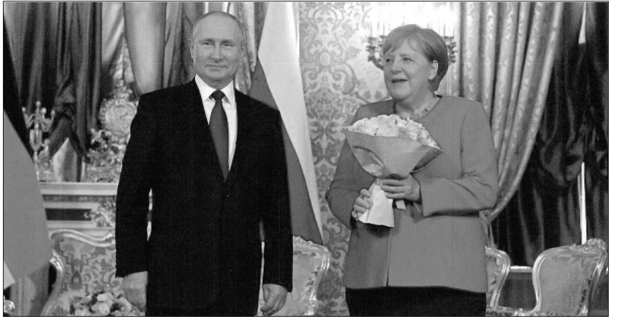
Kytici na rozloučenou dal Vladimir Putin kancléřce Angele Merkelové

Rozhovory trvaly tři hodiny. Poté společně vystoupili na tiskové konferenci. Kancléřka uvedla, že Minské dohody jsou jedinou variantou na vyřešení situace na Ukrajině dle mezinárodního práva, čehož využil ruský prezident a požádal ji, aby zapůsobila na ukrajinské vedení, které dohody bojkotuje