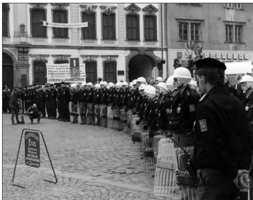
Chebská manifestace 24. 9. 1994