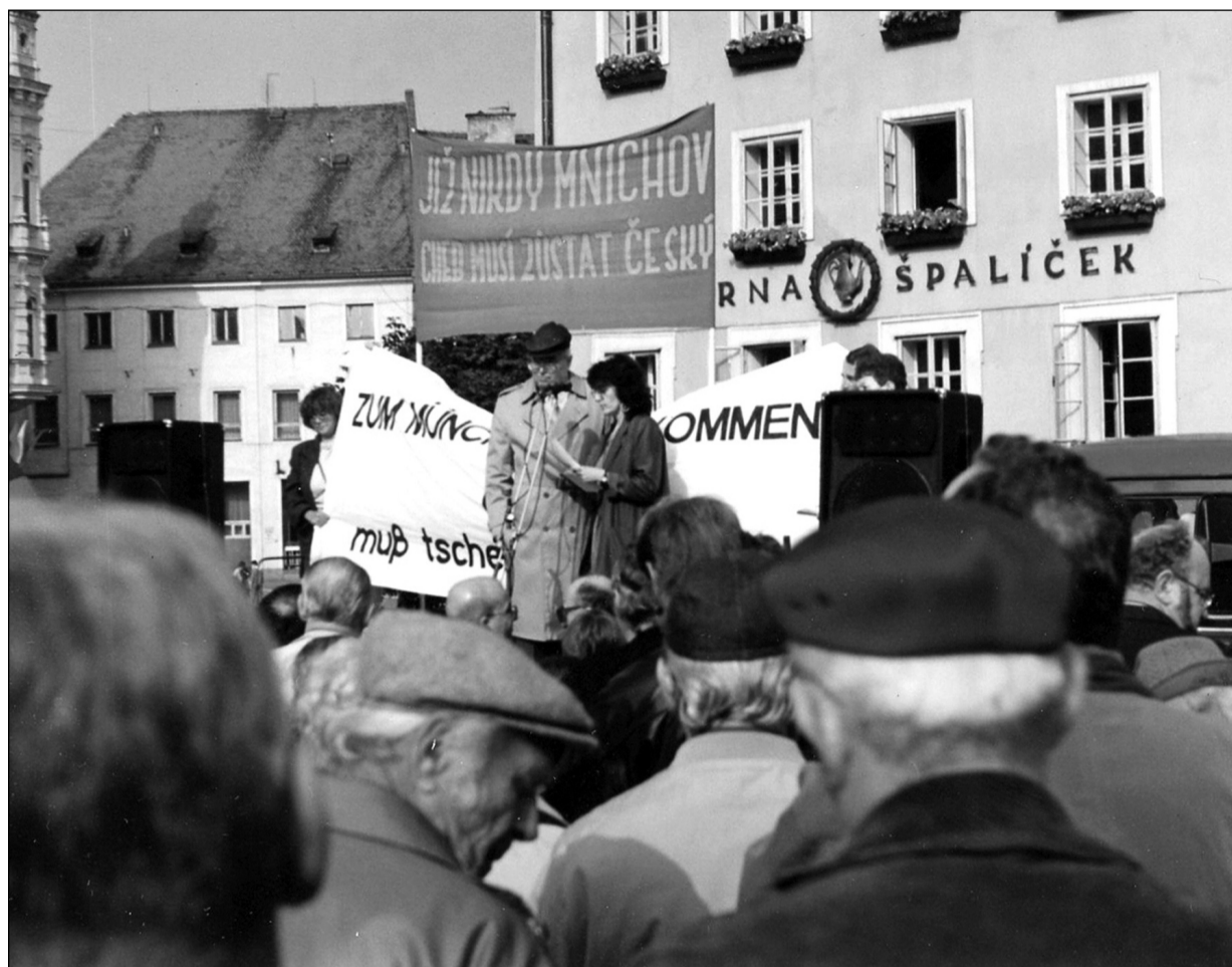
Chebská manifestace 24. 9. 1994.

Docela určitě nechceme rozpouštět nacionalistické vášně, jak nám chce vnutit pan starosta. Kdo rozpouští nacionalistické vášně, to jsme zažili na vlastní kůži na mostě v Ústí nad Labem. To činí ten, kdo žádá zrušení Benešových dekretů, ten, kdo dovoluje německému kapitálu rychlé pronikání do naší ekonomiky v nevidaném rozsahu a zřejmě bez jakékoliv kon-