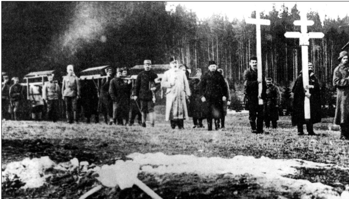
Dlouhý zástup rakví

Podmínky ubytování v táborech byly tak špatné, že tu vězňové mohli jenom umírat a nepřežít. Mauzoleum srbských zajatců v Jindřichovicích (okres Sokolov, Česká republika) je místem věčného odpočinku 7100 Srbů a 189 Rusů, kteří zemřeli v koncentračním táboře za první světové války.