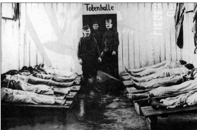
Táborová márnice byla neustále plná