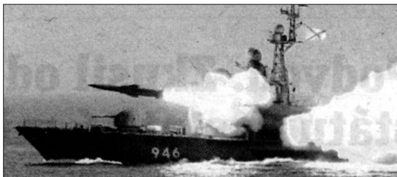
Odpálení hypersonické střely Zirkon