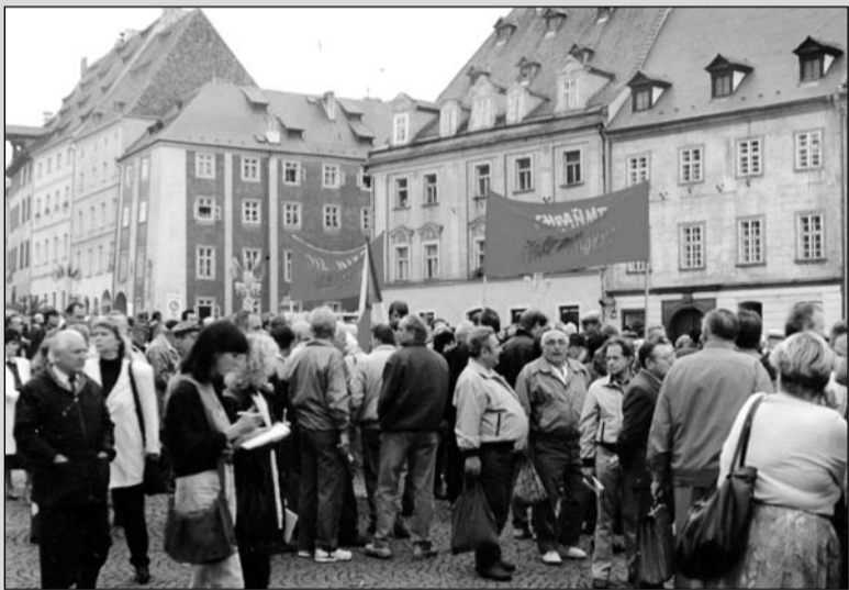
Pohled na manifestující

Pod názvem „Ne Mnichovské dohodě“ a „Cheb musí zůstat český“