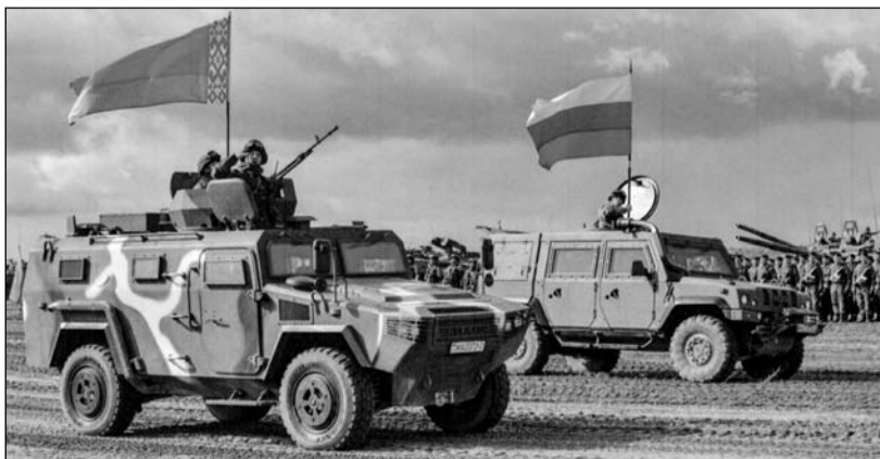
Nástup přátelenských vojsk pod vlajkami (zleva) Běloruska a Ruska

klad Arménie, Kazachstánu, Kyrgyzstánu, Indie, Mongolska, Srí Lanky, a více jak 80 typů vzdušné, 760 pozemní techniky a také 15 lodí na 14 polygonech Ruska a Běloruska. Byli pozváni i zahraniční pozorovatelé, např. z Litvy a OBSE. Poprvé v historii byl uskutečněn noční výsadek s BMD-4M, pásovým plovoucím vozidlem a také použity bojové roboty URAN-9, NERECHTA anebo PLATFORMA-M v konkrétních cílech.