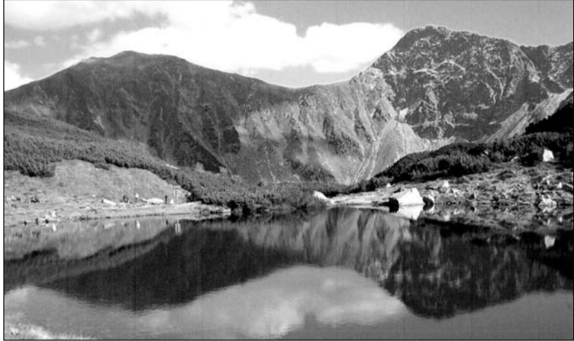
Nádherné tatranské jezírko

Její představitelé odmítli vlastenecké tradice a horovali pro „odvěkou“ a „blahodárnou“ podřízenost českých zemí německé říši. Až do 15. března 1939, kdy nás obsadily kolony motorizovaných jednotek německé armády. Okleštěná republika byla rozbita, my se stali ponížným „protektorátem“ fašistické „Říše“, Slovákům nastolili údajně samostatný „stát“.