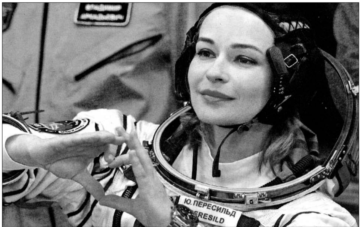
Půvabná ruská herečka Julija Peresildová se stala vesmírnou filmovou hvězdou. Ruská kosmická loď s filmářským týmem bezpečně přistála 17. října na kosmodromu Bajkonur

Pro Roskosmos má projekt natáčení filmu na ISS i jiný než jen