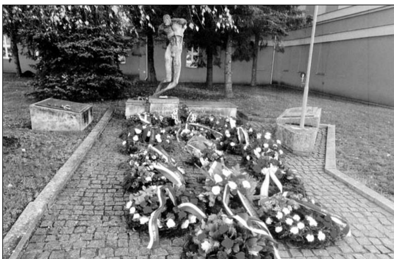
Pietní věnec na ruzyňském poprávišti