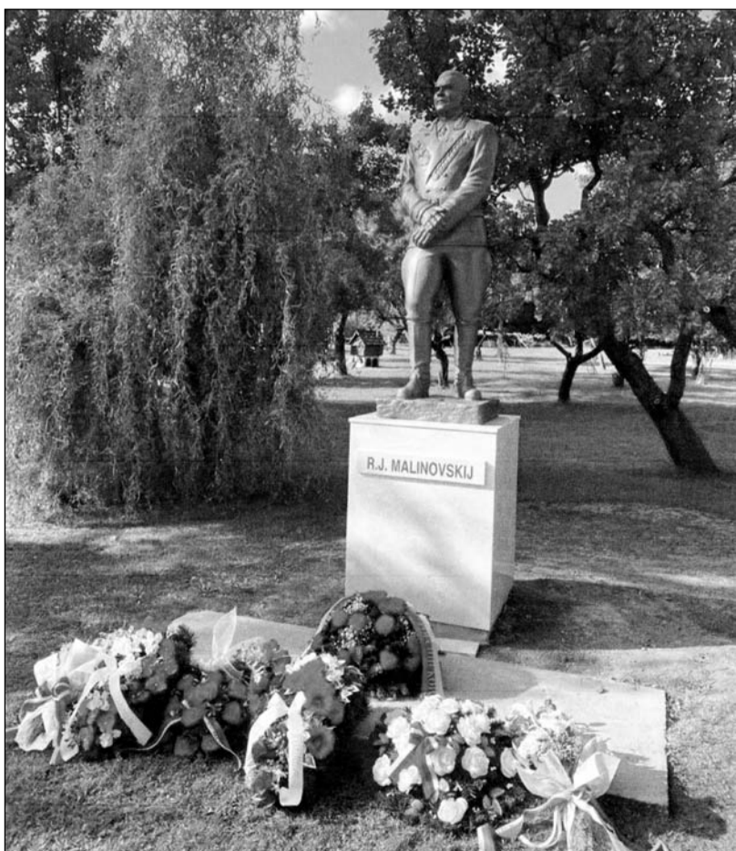
V obci Starý Tekov vztyčen pomník Rodiona Malinovského, maršála SSSR