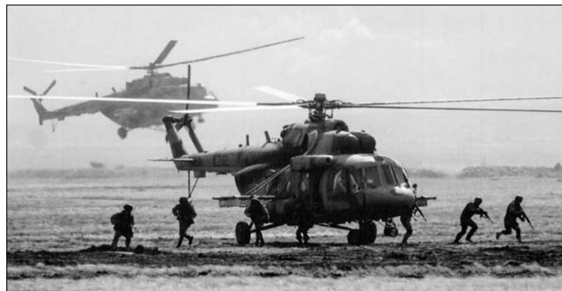
Bojový výsadek z helikoptéry

Všechna tři cvičení se uskutečnila v září. V říjnu proběhlo tradiční cvičení SLOVANSKÝ ŠTÍT v Srbsku. Na pozadí zostření situace na srbsko-kosovské hranici se ho zúčastnila nejenom protivzdušná bojová technika z Ruské federace. mhav