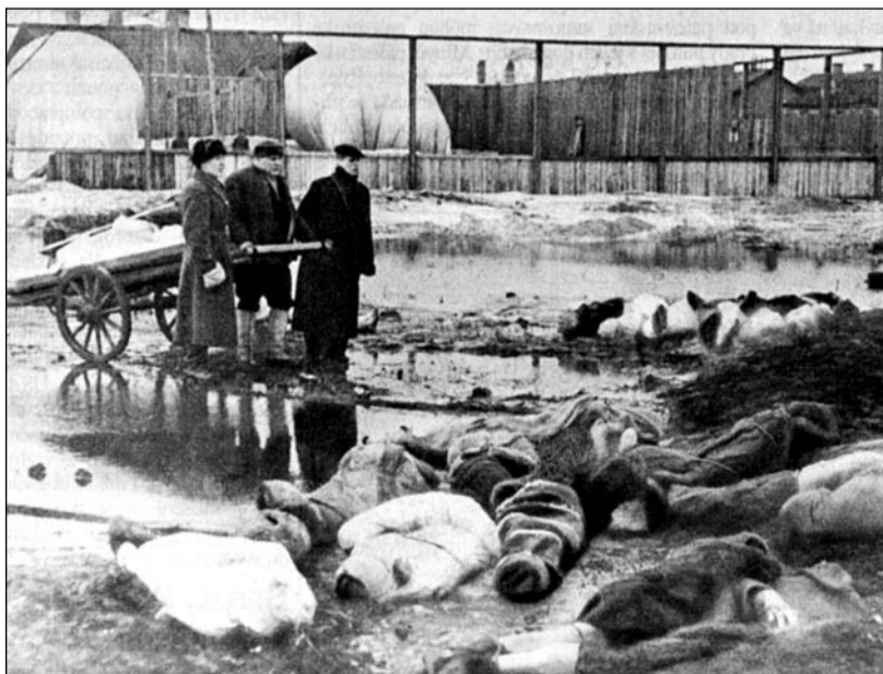
Za kruté blokády pohřbívali mrtvé Leningradany na hřbitově Volkovo