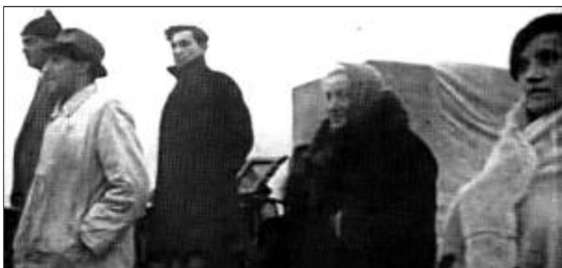
Češi prchající před fyzickým, psychickým a ekonomickým terorem

SLOVANSKÁ VZÁJEMNOST č. 259/2021, cena 10 Kč.