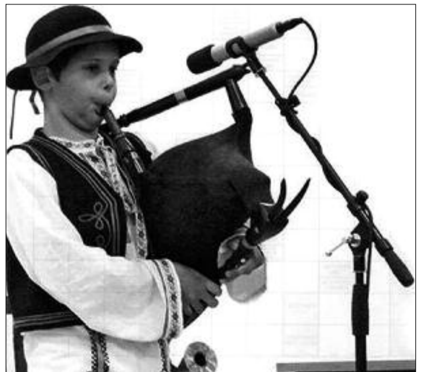
Mladičský muzikant z časopisu „Dotyky“

Vďaka týmto obciam a zápisu gajdošského nehmotného klenotu do zoznamu UNESCO sa región Gron (historický názov rieky Hron) dostal do širokého povedomia na Slovensku.