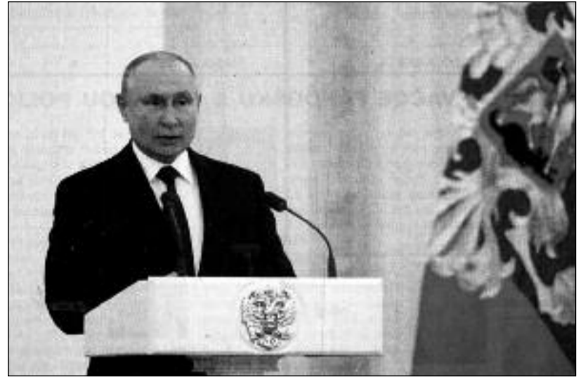
Vladimir Putin se za návštěvy Victoria Nulandové kriticky vyslovil k rusko-americkým vztahům

„Ona a její ruští kolegové jednájí o našich dalších kontaktech s prezidentem Bidem. Takže se