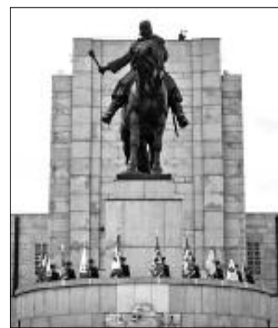
Národní památník na Vítkově

stoupení exprezidenta ČR Václava Klause, které publikujeme na straně 6. (Pokračování na s. 2)