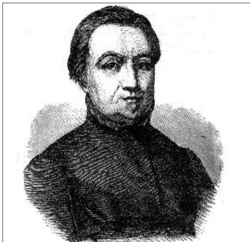
Bohuslav Balbín - archivní portrét