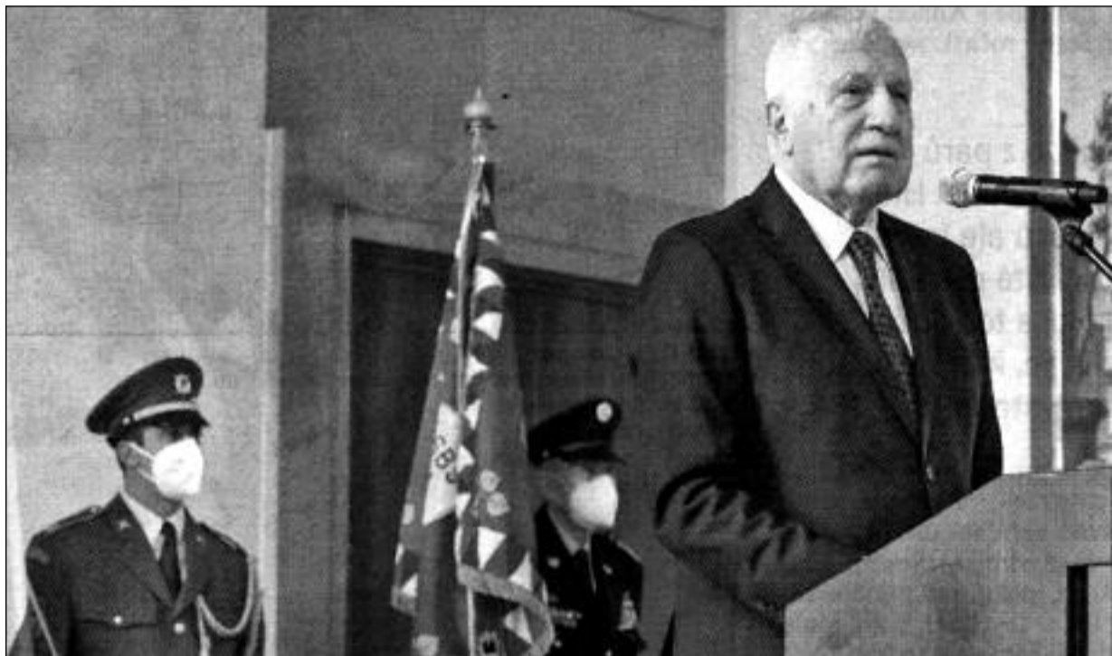
Václav Klaus při svém vystoupení 28. 10. 2021 v Míčovně Pražského hradu.

Tito „bořitelé našeho světa“ odmítají existenci národních států, rodiny a lidské přirozenosti a ke