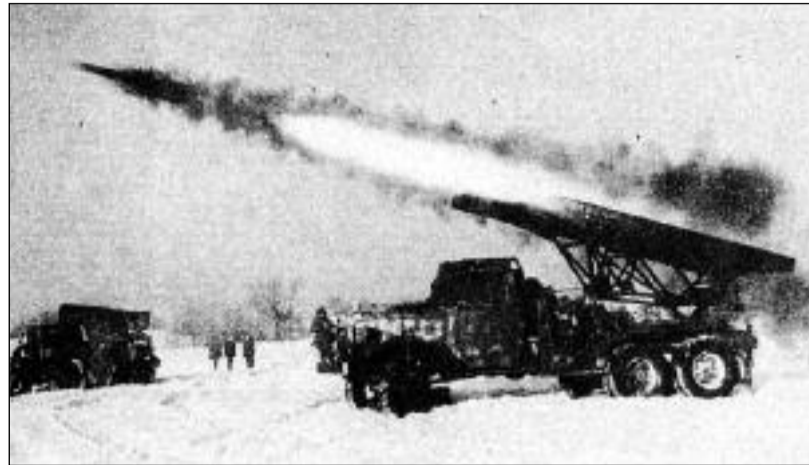
Odpálená střela z raketometu Kašuša

Přišli ale další velitelé, kteří z kašuší (původ jména lze hledat nejspíše v písni o dívce, jejíž milý odešel do armády) vytvořili jednu z nejslavnějších zbraní války. Jejich rozšíření hrálo do karet více věcí: výroba byla jednoduchá, díky umístění na podvozku nákladních automobilů – často amerických studebakerů – byly pohyblivé a salva jedné baterie tvořené