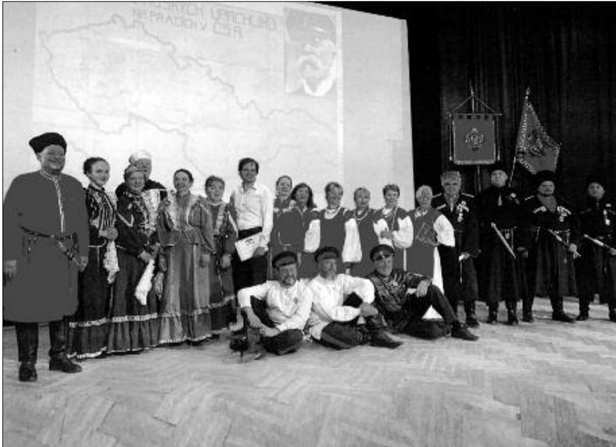
Umělecké soubory – „Kozáci Vltavy“, „Děvčata“ a „Donští kozáci“