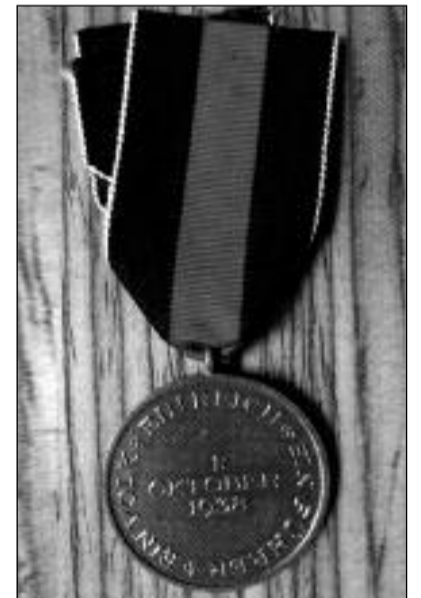
Zadní strana německé medaile, „Medaille zur Erinnerung an den 1. Oktober 1938“ (v upomínku na připojení Sudet). Těchto medailí bylo uděleno přibližně 1 200 000 kusů, což potvrzuje opravdu velké masové zapojení sudetských Němců do akcí proti Československé republice a teroristických útoků v pohraničí.