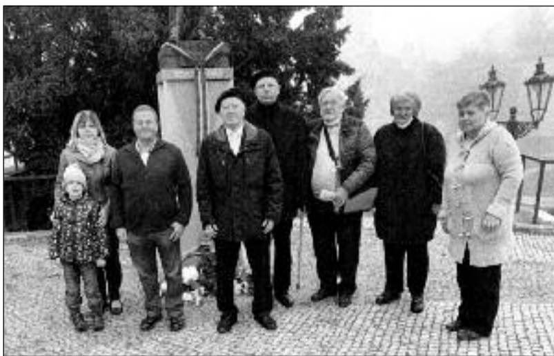
Účastníci vzpomínkového aktu z vlasteneckých organizací (Levicové kluby žen, Společnost Julia Fučíka a SV ČR) před Benešovým pomníkem