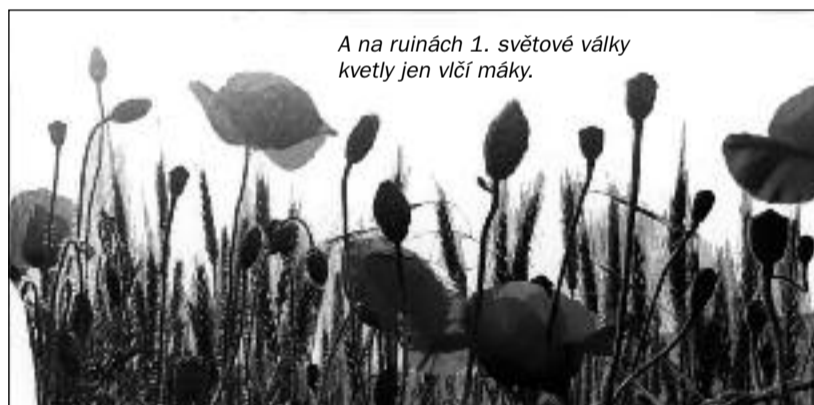
A na ruinách 1. světové války kvetly jen vlčí máky.