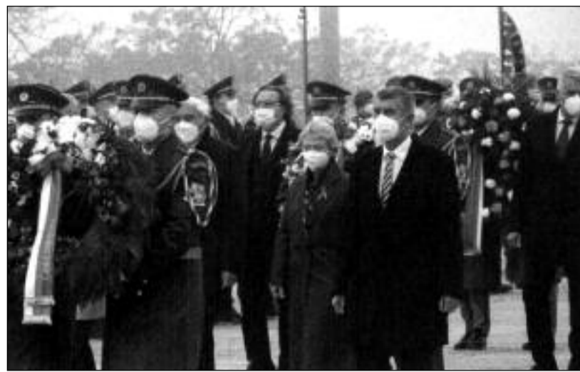
Premiér vlády ČR Andrej Babiš při vzpomínkovém aktu na Vítkově.

„Vznik první Československé republiky byl předpokladem samostatné slovenské státnosti,“ řekla 28. října v Bratislavě u Památníku čs. státnosti novinářům Zuzana Čaputová, prezidentka Slovenské republiky. Položila tady věnce k so-