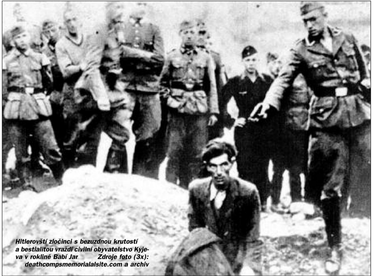
Hitlerovští zločinci s bezuzdnou krutostí a bestialitou vraždí civilní obyvatelstvo Kyjeva v roklině Babí Jar