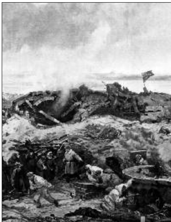
31. ledna nad mohylou zavál Rudý prapor. Byla zlikvidovaná jižní skupina protivníka v čele s feldmaršálem Paulusem a 2. února 1943 kapitulovala severní skupina v čele s generálem Schtrekkerem