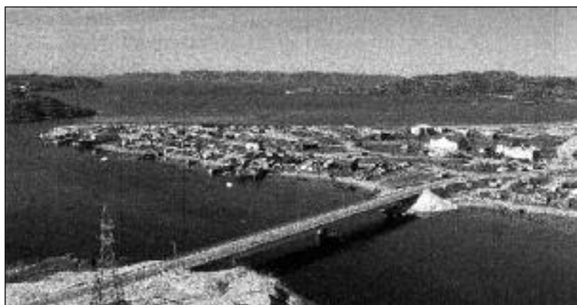
Ze vsi Teriberka u Murmansku povede komunikační kabel do přístavu Vladivostok