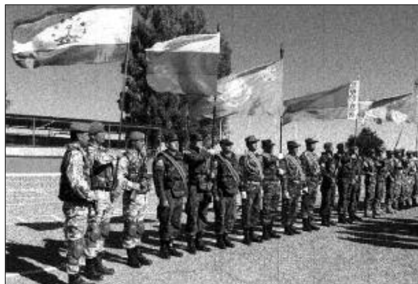
Vojáci organizace Smlouvy o kolektivní bezpečnosti sedmi zemí