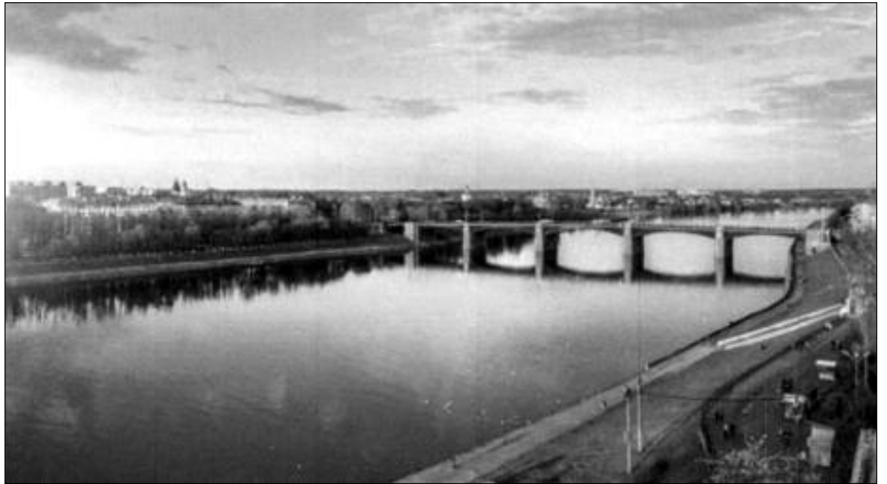
Ilustrační foto: Matka ruských řek - Volha. Na jejích březích ve Stalingradu počátkem roku 1943 zazvonila hitlerovskému Německu hrana

doby Švýcarsko ani jednou (!) nebojovalo.