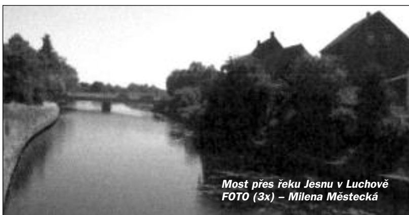
Most přes řeku Jesnu v Luchově