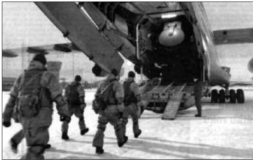
Ruští vojáci vcházejí do letounu, s nímž odletěli do Kazachstánu