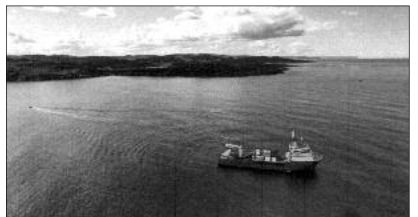
Loď, pokládající kabel na mořské dno

Kabelové spojení má být dokončeno v roce 2026. Moskva usiluje o zlepšení nerovnoměrné komunikace a infrastruktury na dalekém severu, kde posílila svou vojenskou přítomnost, a také se snaží rozvíjet severní námořní cestu u polárních břehů Ruska, aby se stala alternativou k hlavní námořní