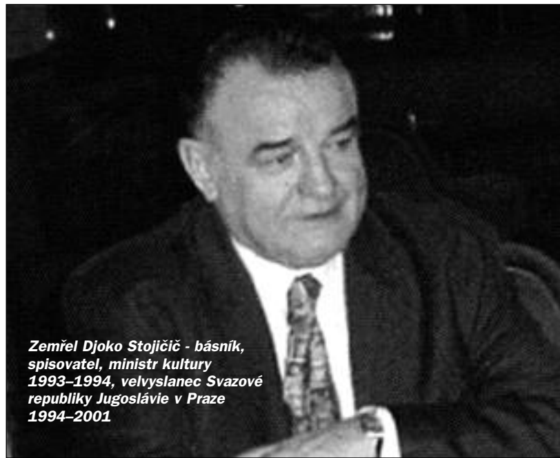
Zemřel Djoko Stojičić - básník, spisovatel, ministr kultury 1993–1994, velvyslanec Svazové republiky Jugoslávie v Praze 1994–2001

SRBSKÉ SDRUŽENÍ SV SAVA СРПСКО УДРУЖЕЊЕ СВ. САВА pořádá pod záštitou prezidenta České republiky Miloše Zemana X. DNY SRBSKÉ KULTURY V PRAZE 10. Дане српске културе у Прагу