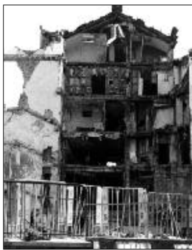
Natovskými piráty vybombardovaná budova televize v Bělehradě