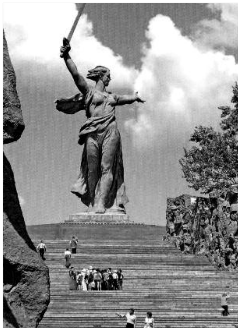
Hlavní monument Mamajovy mohyly „Matka – vlast volá“ Rozměry – výška 52 m, meče – 33 m, celková výška 85 m. Váha 8 tisíc tun. Je vyrobena ze železobetonu.