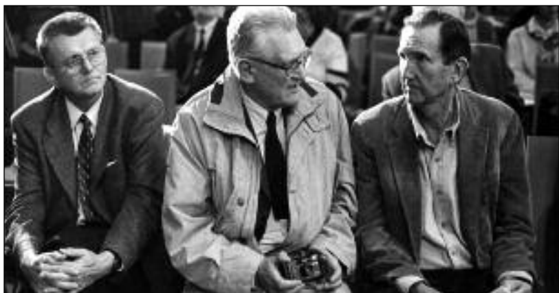
Na tribunálu v Berlíně vystoupil i někdejší ministr spravedlnosti USA Ramsey Clark (zeďla vpravo), který rovněž tvrdě kritizoval agresí Severoatlantické aliance proti Jugoslávii