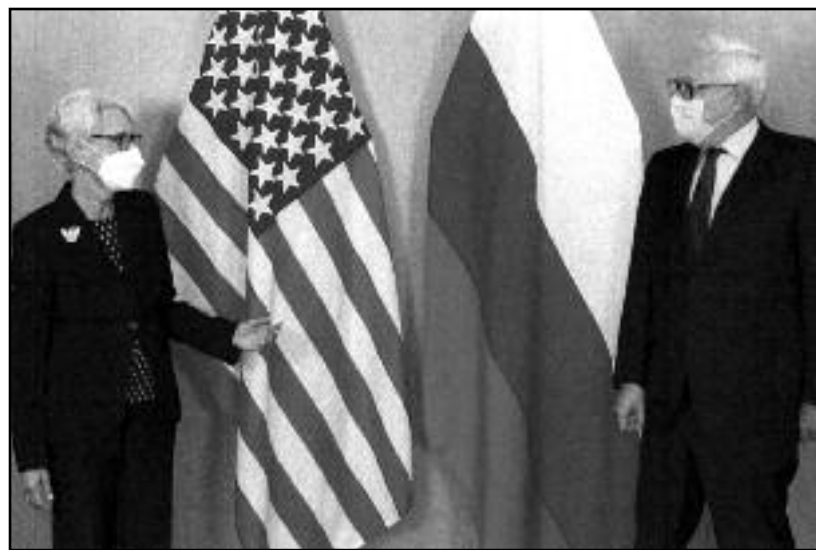
Na snímku ze Ženevy Wendy Shermanová a Sergej Rjabkov

Na jednání Rady NATO – Rusko 12. ledna v Bruselu třicítka členských zemí s veškerou odmítla ruské požadavky na záruku, že Ukrajina se nikdy nestane členem NATO, a na stažení jednotek Aliance a zbraní ze zemí východního křídla bloku. Přitom její generální tajemník Jens Stoltenberg falešně pomluvil Rusko z nepřipravenosti dohodnout se na plánu příštích rozhovorů. Vytasil se také s hnusnou výhrůžkou: pokud by Rusko Ukrajinu napadlo, zváží NATO posílení přítomnosti u svých východních hranic. Rusko bylo vyzváno, aby stáhlo armádu od hranic s Ukrajinou. Spojenci dle Stoltenberga nejsou ochotni slevit ze základních principů a přistoupit na ruské podmínky. Křečovitě nasazují Rusku masku agresora. Moskva rozhodně popírá, že se