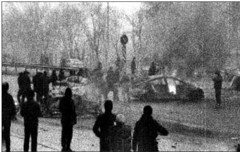
Hořící auto na ulici města Almaty