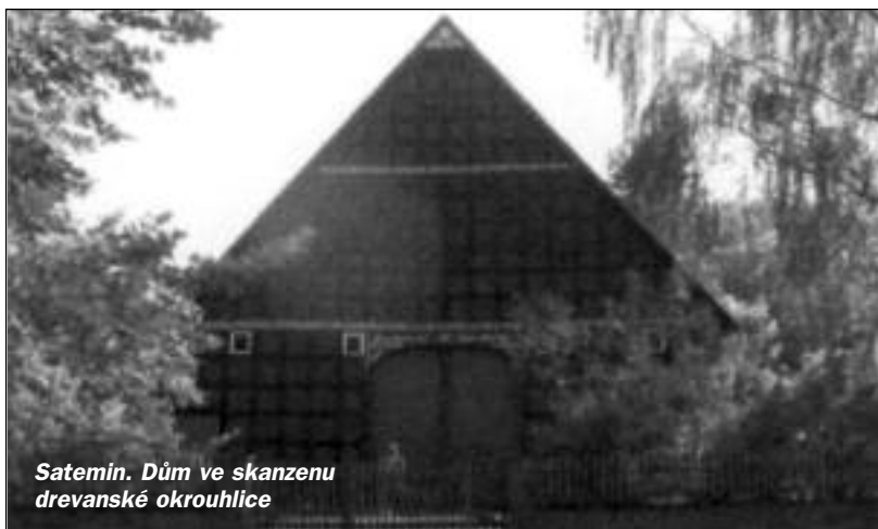
Satemin. Dům ve skanzenu drevanské okrouhlice