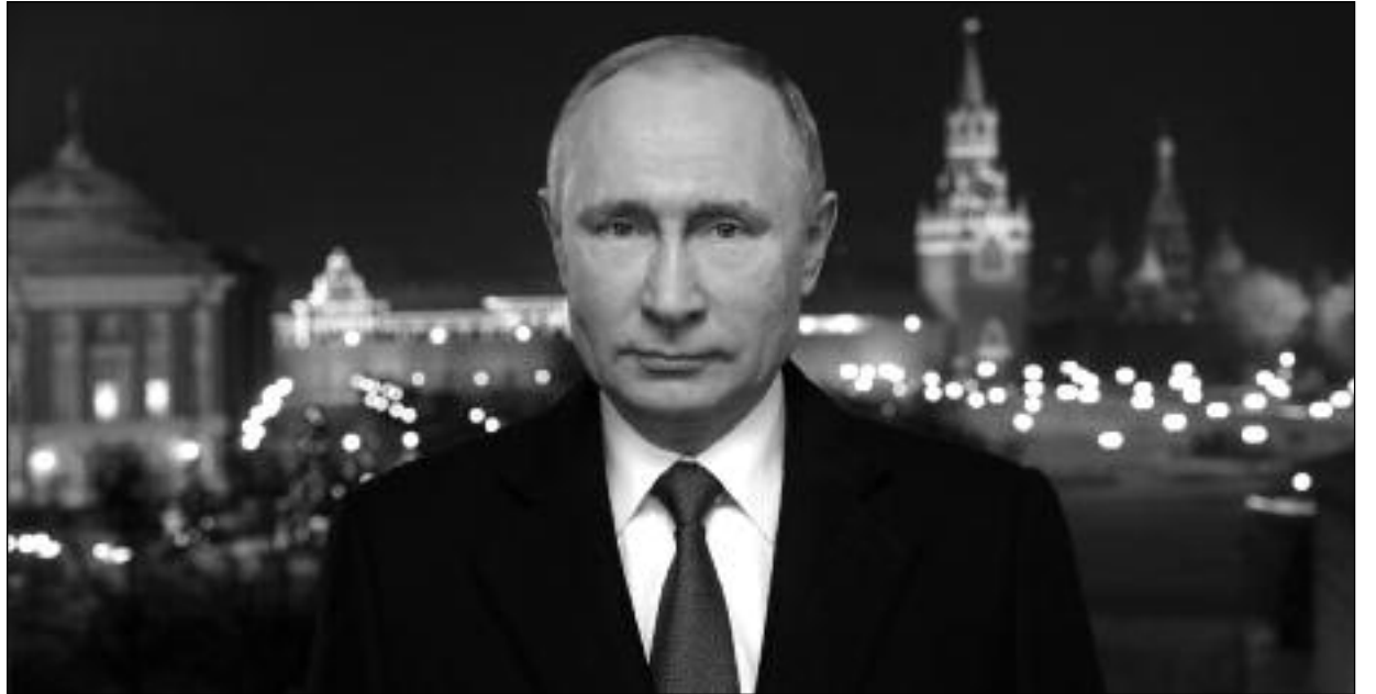
Prezident Vladimir Putin při novoročním projevu

Ukrajinské úřady se dvakrát pokusily vyřešit problém v Donbasu silou. Osobně jsem Porošenka přesvědčil, že není možná žádná vojenská operace! „Ano, ano,“ začal, a výsledek? Okolí, ztráty. Minské dohody. Jsou dobré, nebo ne? Domnívám se, že jsou jediné možné! V čem je tedy problém? Nechtějí je realizovat. Přijali zákon o původním obyvatelstvu, prohlásili Rusy žijící na tomto území, na svém území, za nepůvodní obyva-