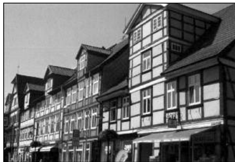
Malebná hrázděná domů vtiskující Wendlandu přitažlivou pečeť a architektonickou krásu

v roce 1293. Centrum města vás dnes přivítá klidnou promenádou plnou obchůdků a míst k obědu či posezení, vroubenou výstavními měšťanskými domy s typickým německým hrázděním. Procházkou přejdete most přes řeku Jesnu i její malý přítok Drawehner Jeetzel, tedy Dravanskou Jesnu. Za návštěvu stojí muzeum v kruhové věži, která je jediným pozůstatkem po zámku z 15. století a Glockenturm, tedy zvonice, součást bývalého opevně-