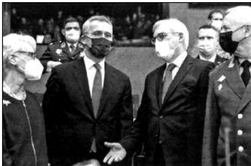
Bruselské jednání: zleva Wendy Shermanová, Jens Stoltenberg, Alexandr Gruško a Alexandr Fomin

chystá Ukrajinu napadnout! Dál setrvává na svých spravedlivých podmínkách. Mluví Kremlu zdůraznil, že jeho země nevede rozhovory z pozice síly, pouze chce zajistit bezpečnost Ruska, které v Bruselu reprezentovali náměstek ministra zahraničí a bývalý velvyslanec při NATO Alexandr Gruško s náměstkem ministra obrany Alexandrem Fominem. USA zde zastupovala Wendy Shermanová. Rusové zcela nezavrhlí ochotu v pokračování rozhovorů. Šéf NATO Stoltenberg také vybochnul jako saze v kamnech a válečnickým rykem oznámil: Aliance se