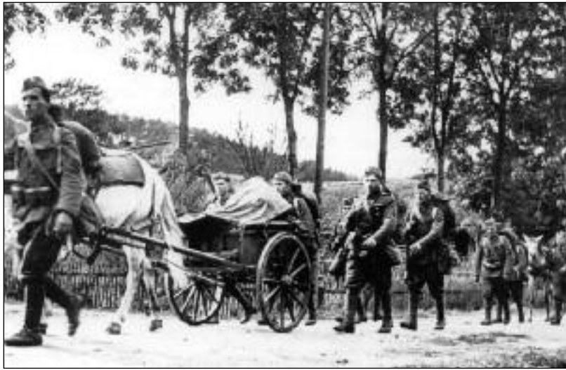
Ústup čs. jednotek z pohraničí. Místo rozkazu k boji přichází nařízení podrobit se

Ovšem později, ještě před polovinou války, začali Němci náhle celý Terezín vystěhovávat a postupně tam umísťovali obyvatele židovského původu. Od dětí až po starce. Ještě v době, kdy se do Te-