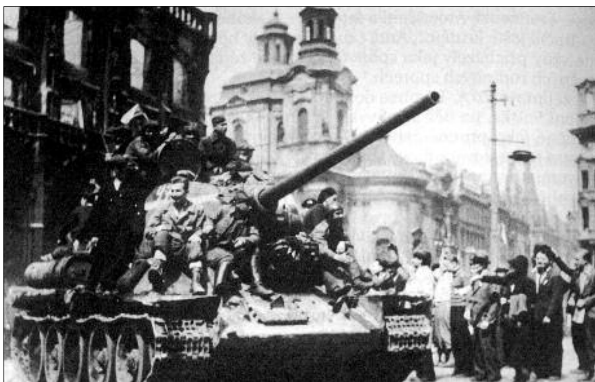
Tankisté sovětské Rudé armády jsou vítáni Pražany 9. května 1945 na Staroměstském náměstí před nacisty poničenou radnicí