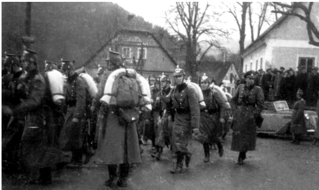
Obsazení silniční křižovatky v Hrbačově u Semil německým četnictvem.