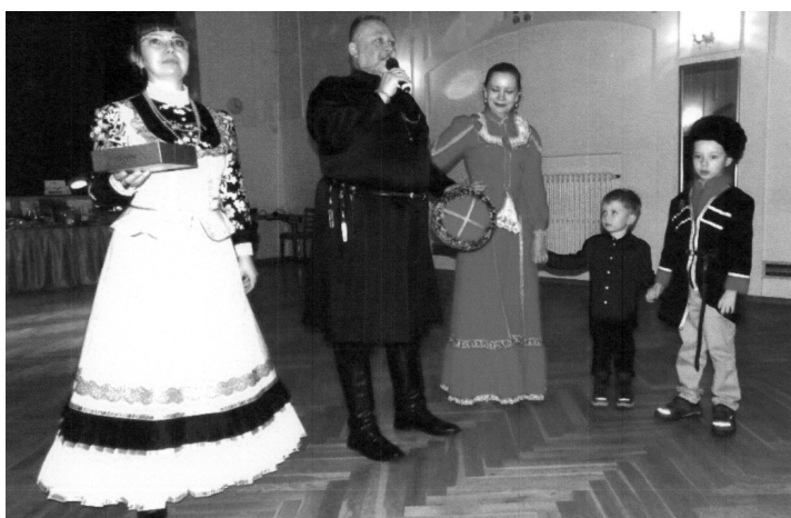
Hlavní výhra v tombole – Kozácká papacha.