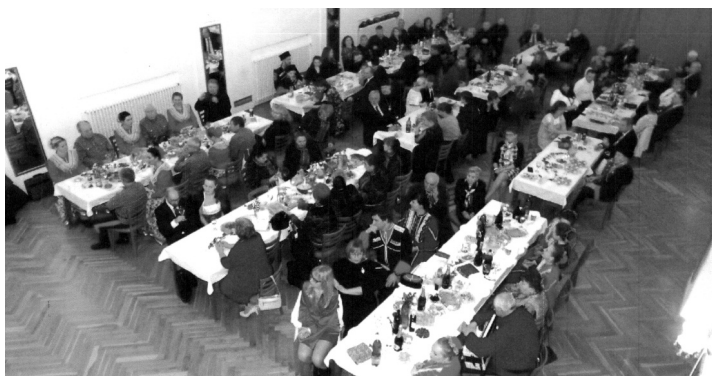
Pohled do sálu.