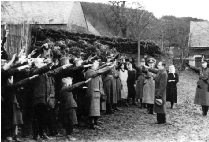
Obsazení Hrádku u Manětína.