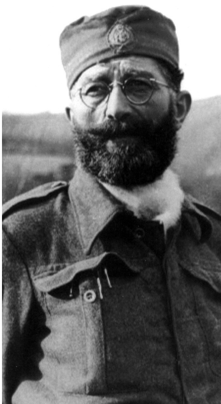
Generál Dragoljub (Draža) Mihailović, velitel JVO

vznikla silná bolševická armáda s tvrdou disciplínou, která koná podle příkazů Moskvy, je čím dále silnější a den ode dne nebezpečnější. Má silnou podporu Britů. Současným Titovým záměrem je proniknout do Srbska a potom porazit národní partyzánské hnutí Draži Mihailoviče (tj. JVO, pozn. autora).“