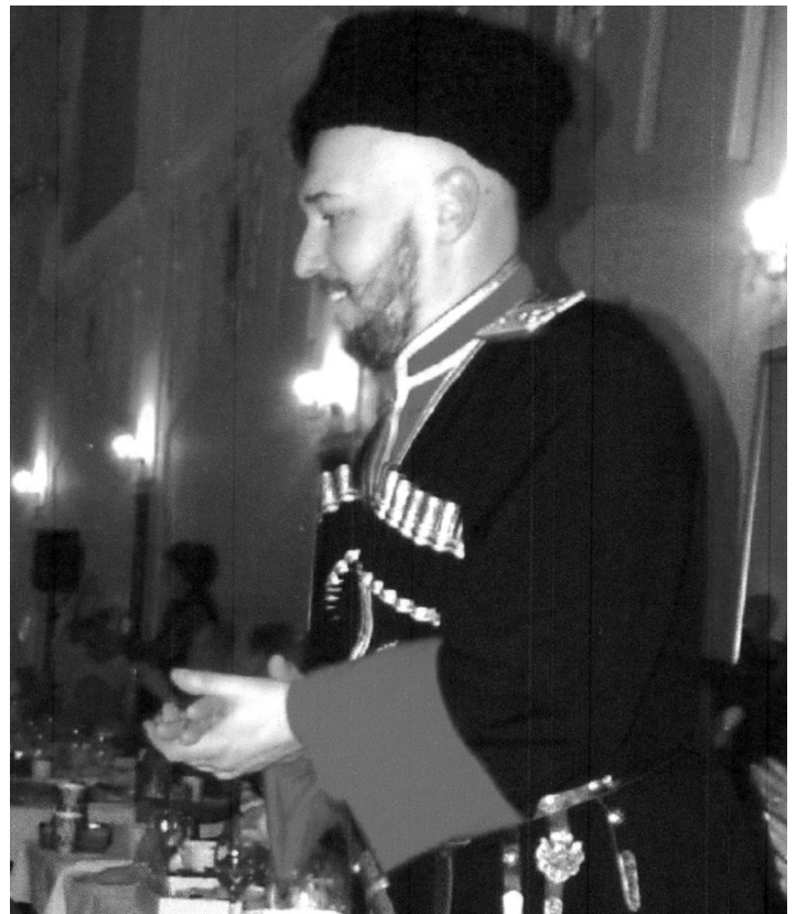
Takový šťastný úsměv nebyl ojedinělý.