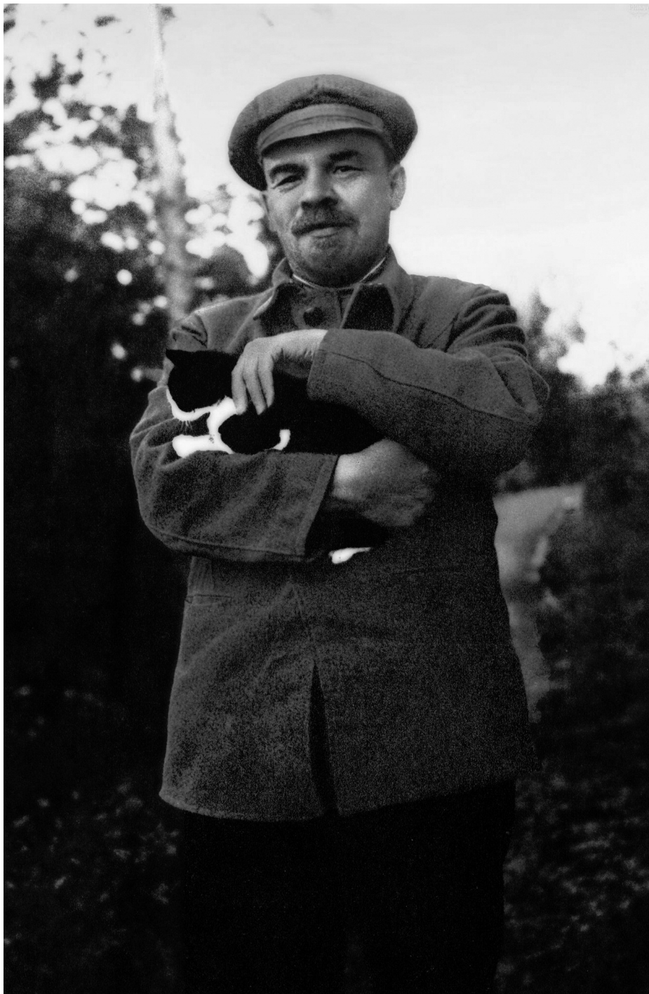
Vladimír Iljič Lenin

dílo Karla Marxe a Bedřicha Engelse rozvinul v praxi.