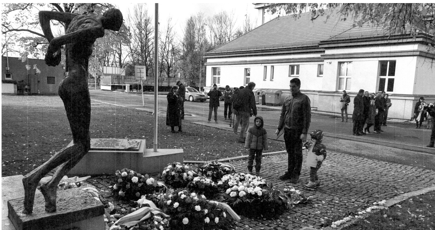
Kasárna Ruzyně – 17. listopad 2023. Pietní akt