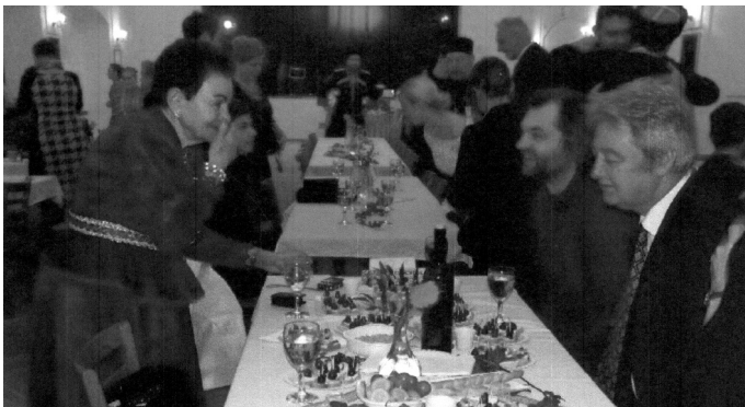
Náš bohatě prostřený stůl.