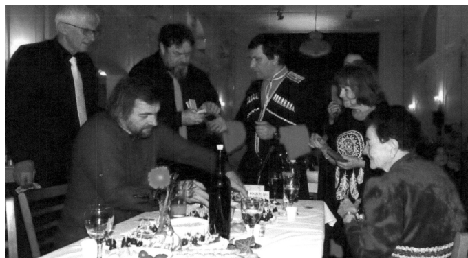
O prodej tomboly byl velký zájem.