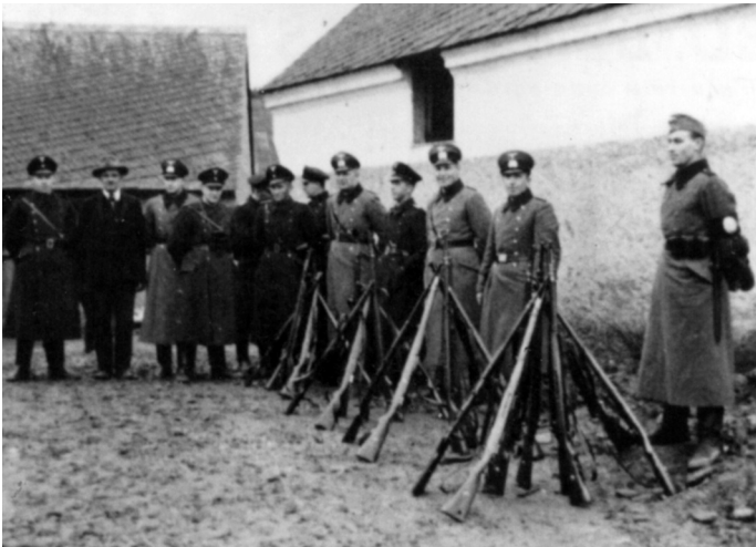
Obsazení Hrádku u Manětína.