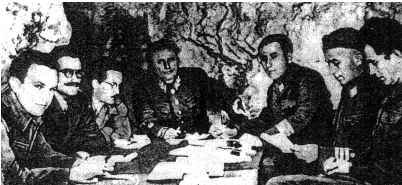
Nejvyšší představitel NOVJ Josip Broz Tito (uprostřed) v čele svých spolupracovníků

V průběhu druhé světové války patřilo území Jugoslávie mezi ty země, ve kterých od počátku okupace a jejího rozbití v dubnu 1941 probíhal nepřetržitý branný odboj. Německo – italské okupanty podporovaly ozbrojené síly ustašovského Nezávislého státu Chorvatsko, slovinští separatisté, albánští fašisté a později oddíly monarchistického Jihoslovenského vojska v otčině (Jugoslovenska vojska u otadžbini – JVO, tzv. četnici).