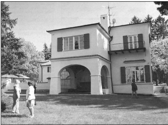
Benešova vila znovu ožívá. Interiéry i exteriéry vracejí návštěvníky do 30. let minulého století.

Pomalou se tak – alespoň zčásti – začíná naplňovat závěť Hany Benešové, která v roce 1973 vyslovila přání, aby vila sloužila jako památník jejího manžela. (SV)