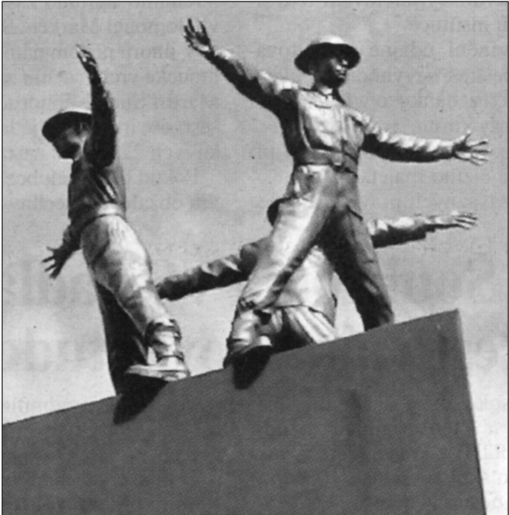
Vrchní část památníku hrdinům atentátu na „kata českého lidu“. Autory jsou David Moješčík a Michal Šmeral (sochaři), Milošlava Tůmová a Jiří Gulbis (architekti). Investor: městská část Praha-Libeň