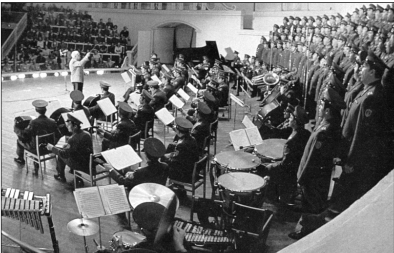
Až po uzávěrce tohoto čísla se konalo ohlášených šest koncertů slavného ruského souboru známého jako „Alexandrovcí“ (na archivním snímku). Vystoupili tentokráte nejenom v Praze (16. 6.), ale také v Jihlavě, Lokti u Karlových Varů, Pardubicích, Olomouci a Ostravě. K jejich turné se v našem časopise vrátíme v příštím čísle – tedy zářijovém.

Nejvýraznějšími osobnostmi tohoto proudu ruské civilizace byli například Kirejevskij, Chomjakov, Aksakov, Samarin, ale pak následuje mnoho dalších jmen. Vznik tohoto společenského proudu se vztahuje na 30. a 40. léta 19. století, tedy zhruba na dobu, kdy podobné společenské procesy v řadě zemí západní a jižní Evropy zrály k prvnímu slovanskému sjezdu, který se v Praze pod vedením Františka Palackého konal v roce 1848.