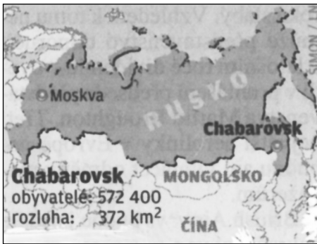
Chabarovsk obyvatelé 572 400 rozloha: 372 km 2 (Mapka: Lidové noviny)

Chabarovsk je spolu s Vladivostokem ostatně nejvýznamnějším správním centrem ruského Dálného východu. Připomíná svou sovětskou minulost jak ulicí Leninovou, tak Marxovou. Je prý to „výspa impéria, kousek Evropy uprostřed Asie“, napsalo Právo. Leží v těsné blízkosti Čínské lidové republiky a je velmi dynamickým pásmu čínsko-ruského